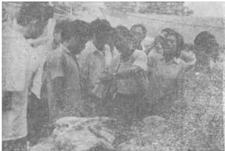
利津县在县直机关聘请“物价、计量监督员”,义务到集市进行物价、计量监督检查,维护了消费者的利益。瞧,一个体户的“秤上把戏”被当众揭穿。

7月10日,垦利县长姜振邦、县人大会主任韩柱祥和一位县委副书记、三位副县长冒雨来到永安乡政府,同永安乡、下镇乡、垦利镇的人大代表对话,征求工作意见。吃午饭时,永安乡负责同志觉得县里领导来了,打算好好招待一